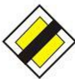
koniec drogi z pierwszeństwem przejazdu