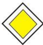
droga z pierwszeństwem przejazdu