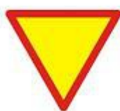
ustap pierwszeństwa przejazdu