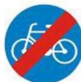
koniec drogi dla rowerów

Zapraszam również do obejrzenia filmików które dla Was nagraliśmy.