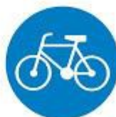
droga dla rowerów