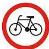
zakaz wjazdu rowerów